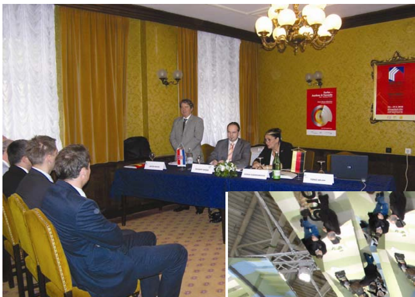
Detalj s predavljanja obrtničkih sajmova

Kroz te se obrtničke sajmove uglavnom provlači tema energetske učin-